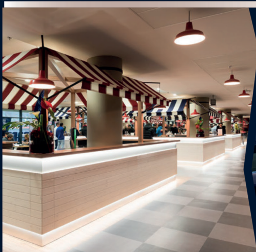
SALON DES LUMIÈRES

CHOISISSEZ LA PRESTATION QUI VOUS CONVIENT